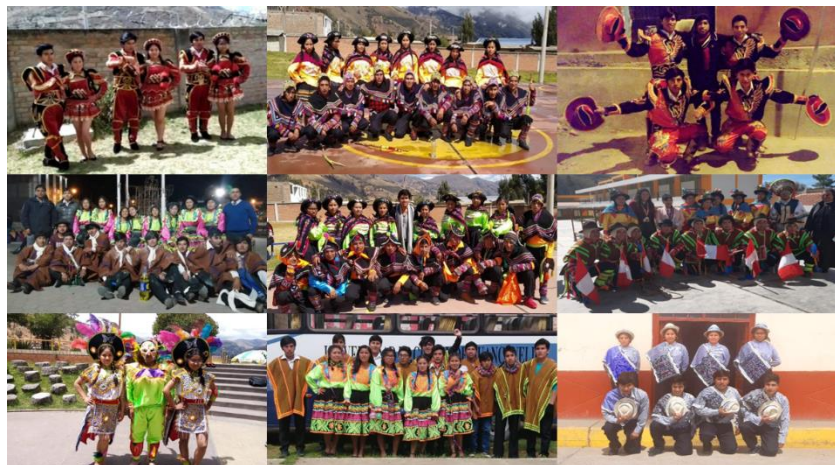
Figura N°6: Disfraces de las distintas danzas presentadas