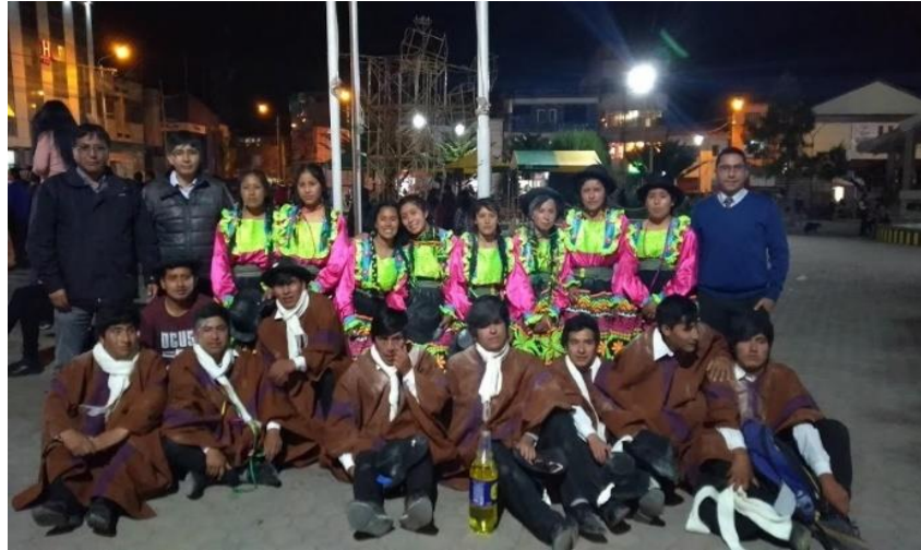
Figura N°9: Pasacalle por el aniversario de la EPIS.