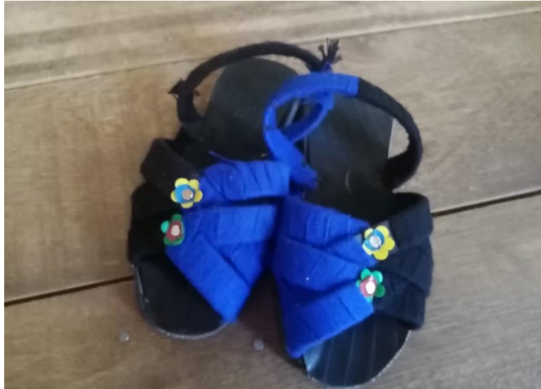
Figura N°4: Ojotas para dama