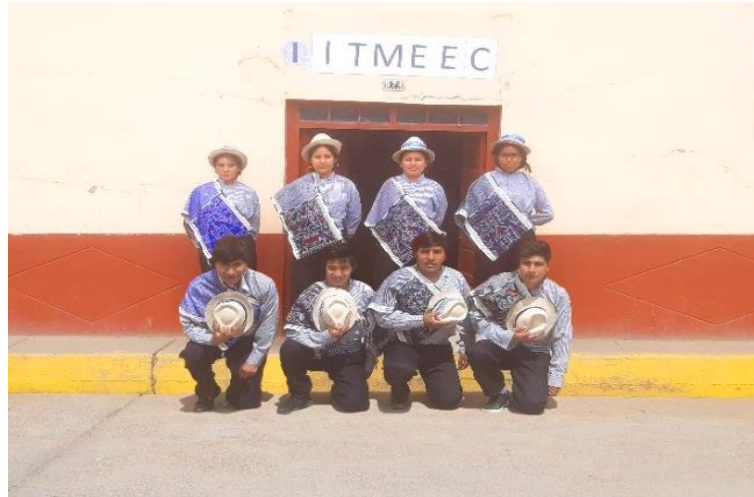
Figura N°19: Presentación por inauguración del local de ITMEEC SAC.