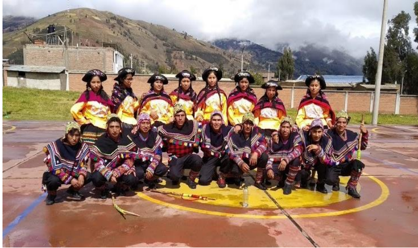
Figura N°13: Presentación por la visita de las autoridades de licenciamiento a la EPIS.