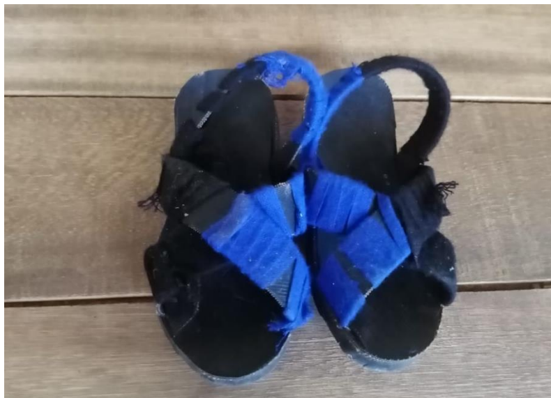
Figura N°5: Ojotas para varones