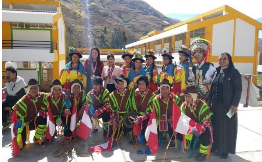
Figura N°15: Presentación por el aniversario del colegio Nuestra Señora de Lourdes.