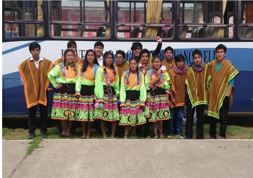
Figura N°11: Participación en la organización de chocolatada a los niños de Marcopata