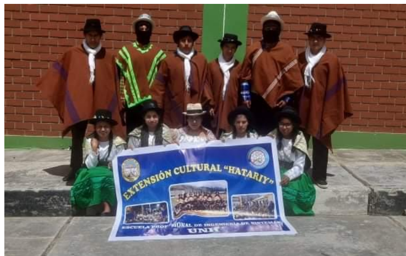
Figura N°18: Presentación por el aniversario I.E. Los Años Maravillosos.