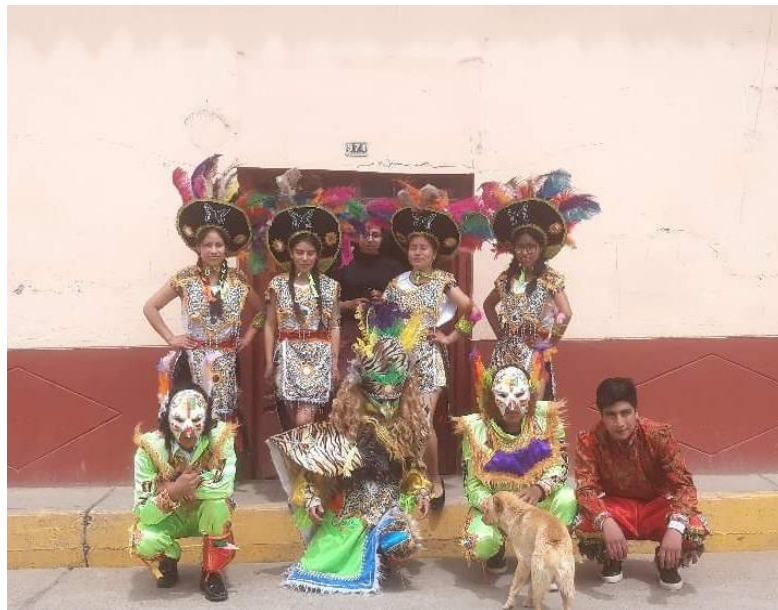
Figura N°16: Presentación por el aniversario de fundación de la empresa ITMEEC SAC