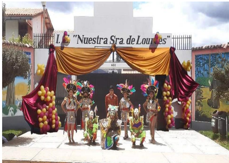
Figura N°12: Participación por el día de la madre realizada en el Colegio Nuestra Señora de Lourdes