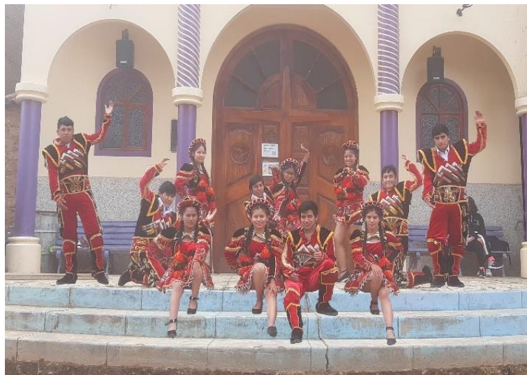
Figura N°27: Presentación por la celebración del tercer aniversario de la botica LUDIFARMA.