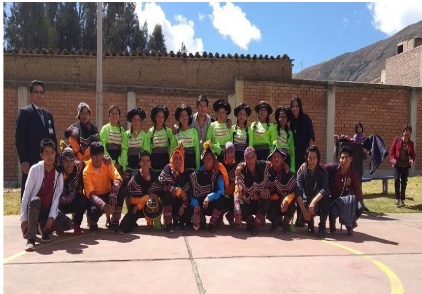
Figura N°14: Presentación por la segunda visita de las autoridades de licenciamiento a la EPIS.