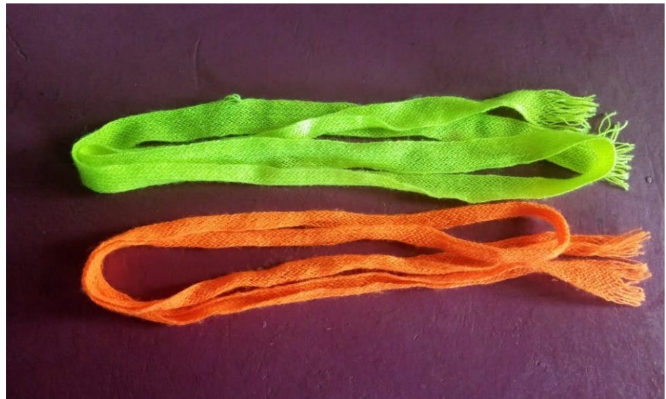
Figura N°3: Cintas de vaca