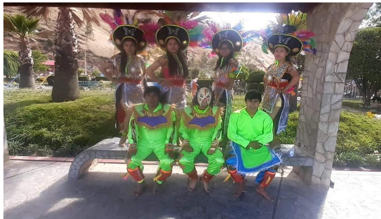
Figura N°23: Presentación virtual por la inauguración de su segundo local de la empresa JATARIY PERÚ SAC.