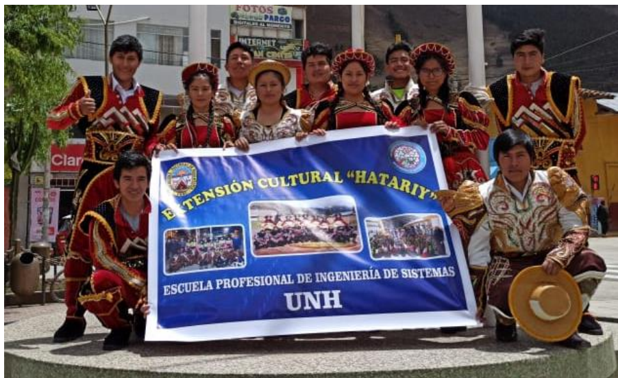
Figura N°1: Banderola del grupo de Extensión Cultural