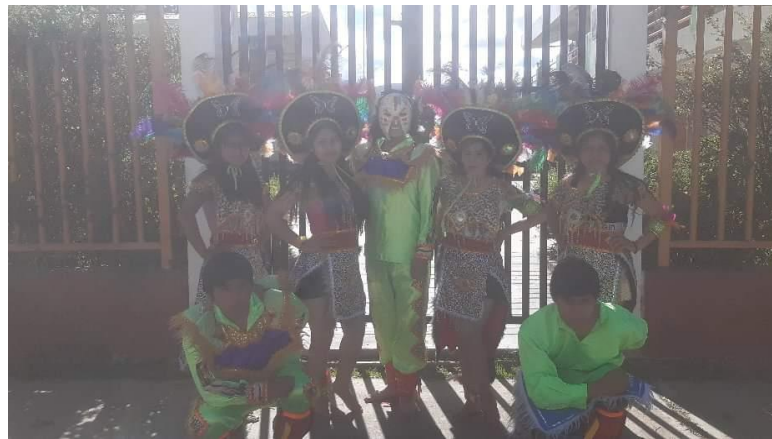
Figura N°22: Presentación virtual por el aniversario de la Mercería CATITA.