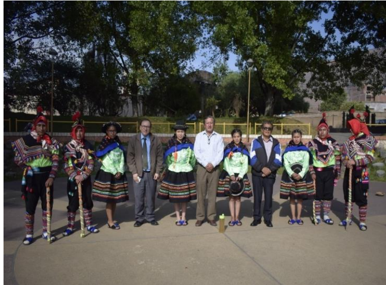
Figura N°3: Presentación por la semana Nacional de la Ciencia realizada por la UNAT