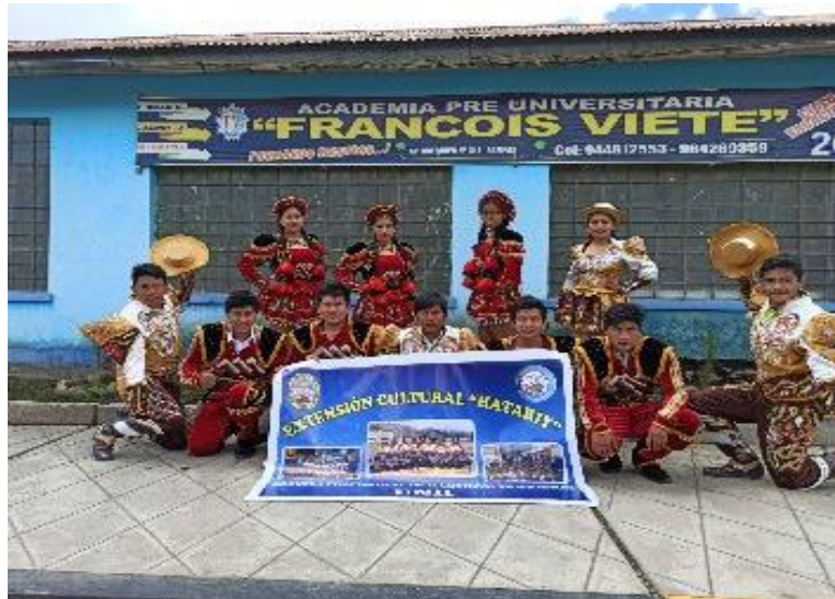
Figura N°20: Presentación virtual por el aniversario de la academia François Viete.