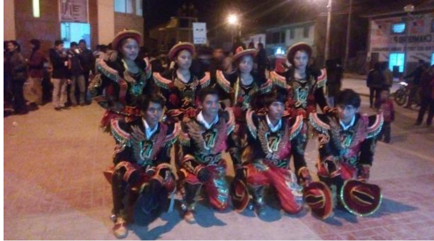
Figura N°7: Presentación en la misa ofrecida por la EPIS al Señor de los Milagros