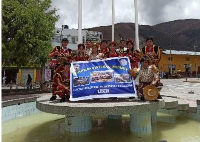
Figura N°26: Participación por la presentación del proyecto denominado “Lavamanos portátil automático con panel solar para zonas urbanas”, ITMEEC SAC.