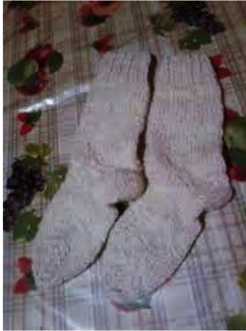
Figura N°2: medias de lana de oveja