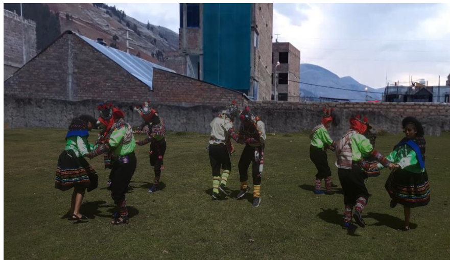
Figura N°10: Presentación en la parte social de aniversario de la EPIS