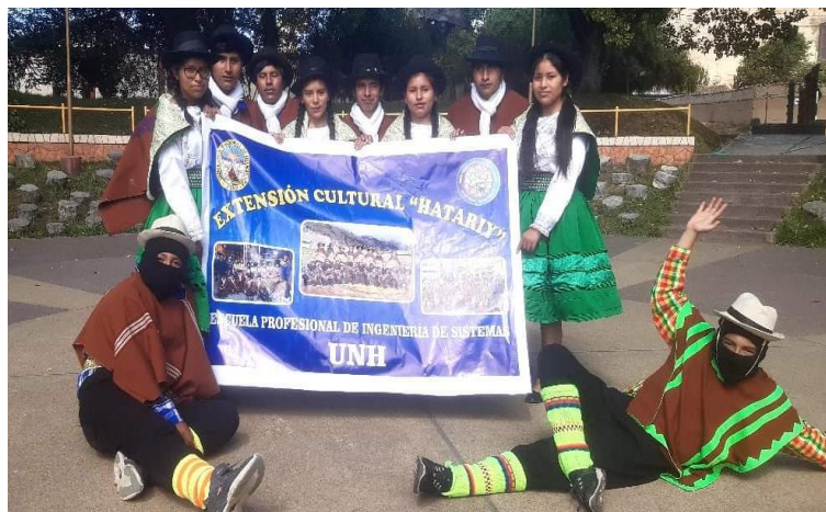
Figura N°25: Presentación por la conferencia de Investigación Formativa dada por la UNAT