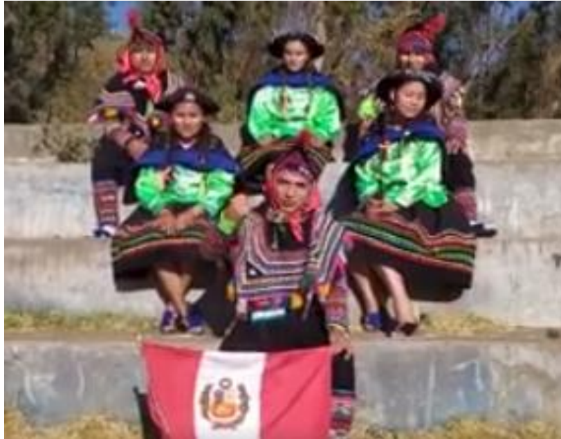
Figura N°24: Presentación por la organización de evento por la Dirección del Instituto de Investigación de la UNAT.