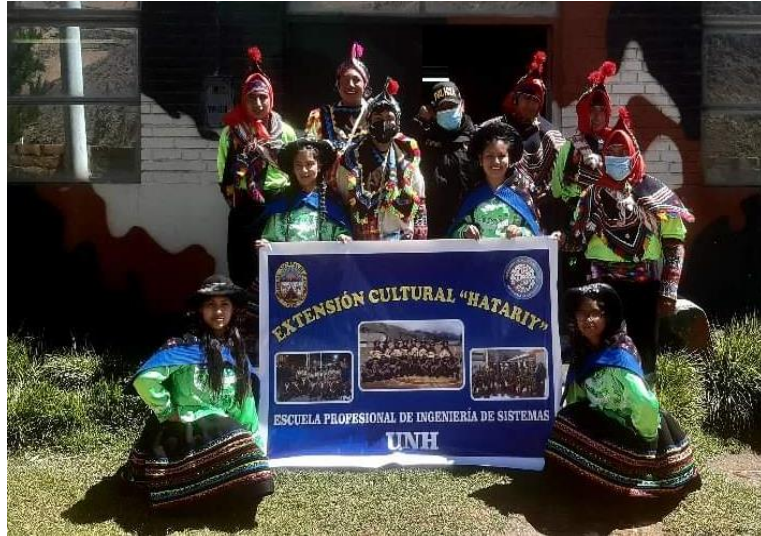
Figura N°21: Presentación virtual por el XIII aniversario del IESTP Nuevo Occoro.