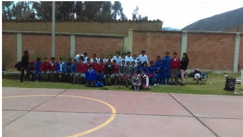
Figura N°8: Presentación por visita del colegio Mariscal Cáceres a la EPIS