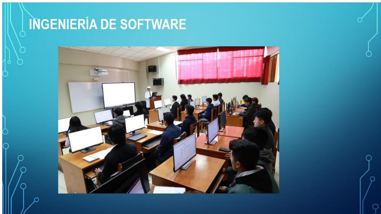
Figura N°04 Diseño de Diapositivas utilizadas en la Orientación Vocacional