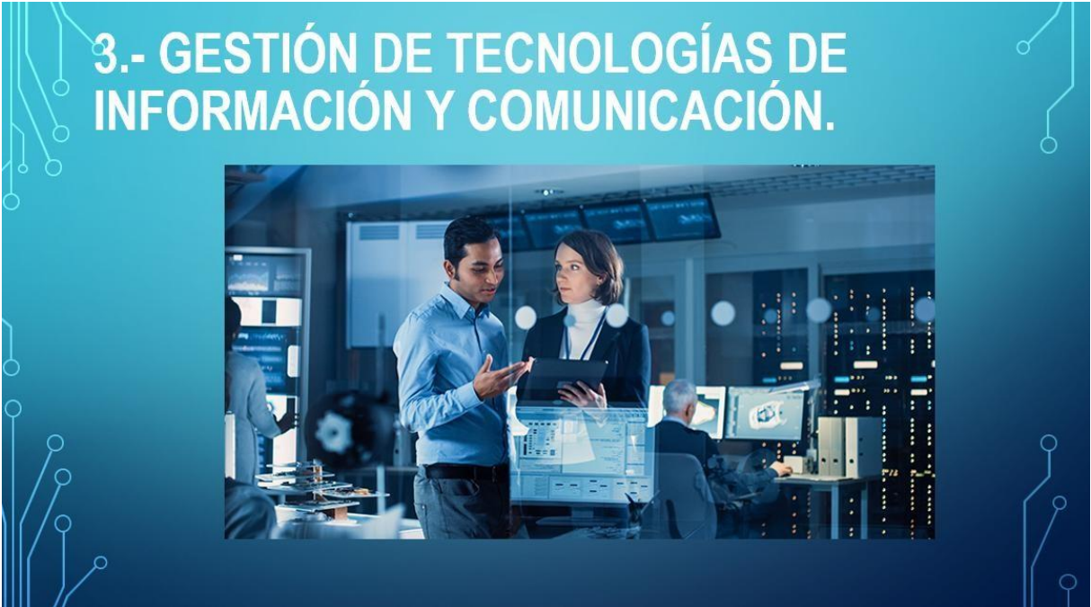
Figura N°06 Diseño de Diapositivas utilizadas en la Orientación Vocacional