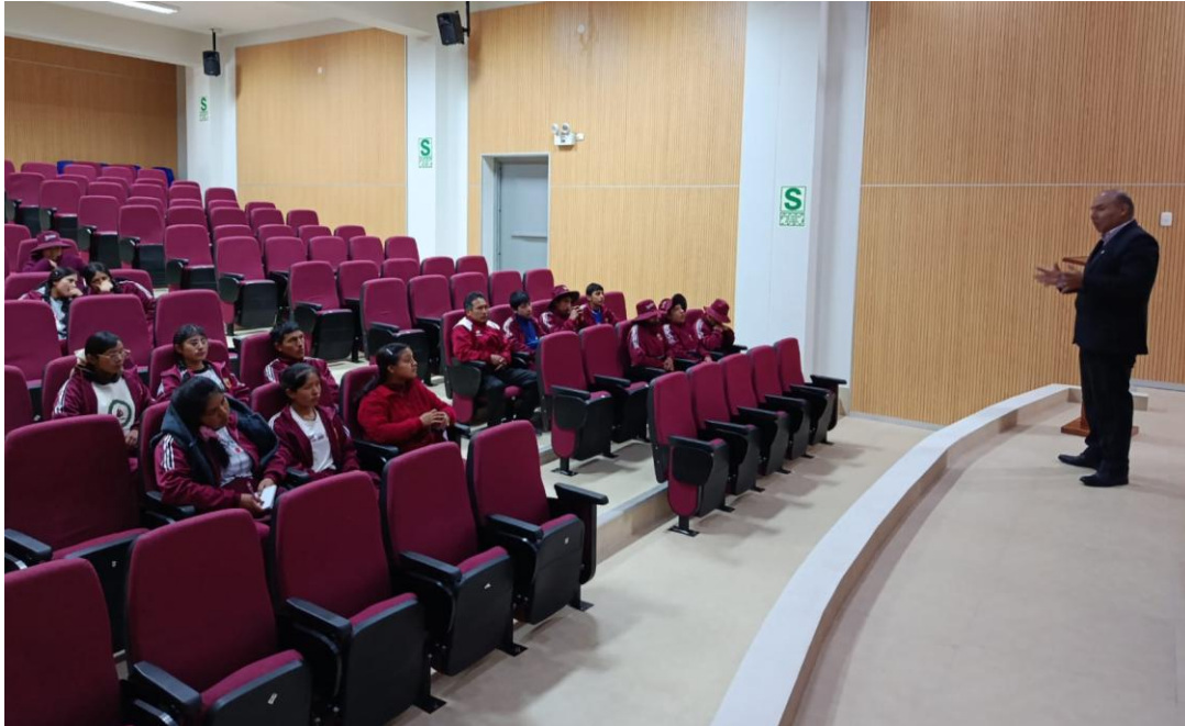
Fotografía N°02: Docentes realizando la Orientación Vocacional a los estudiantes del Colegio Tupac Amaru II.